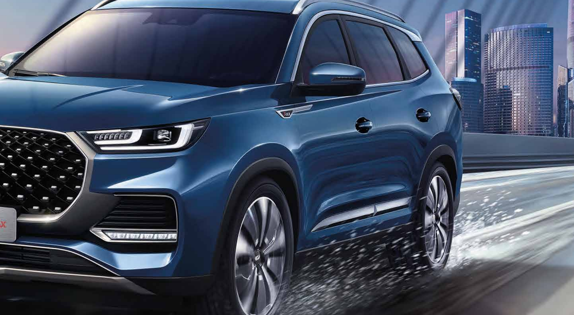
Литые 18" двухцветные диски